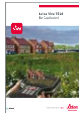
Leica Viva TS16