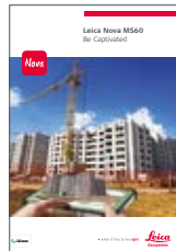
Leica Nova MS60

Illustrasjoner, beskrivelser og tekniske data er ikke bindende. Alle rettigheter er reservert. Trykket i Sveits – Copyright Leica Geosystems AG, Heerbrugg, Sveits, 2015. 836347no – 05.15 – INT